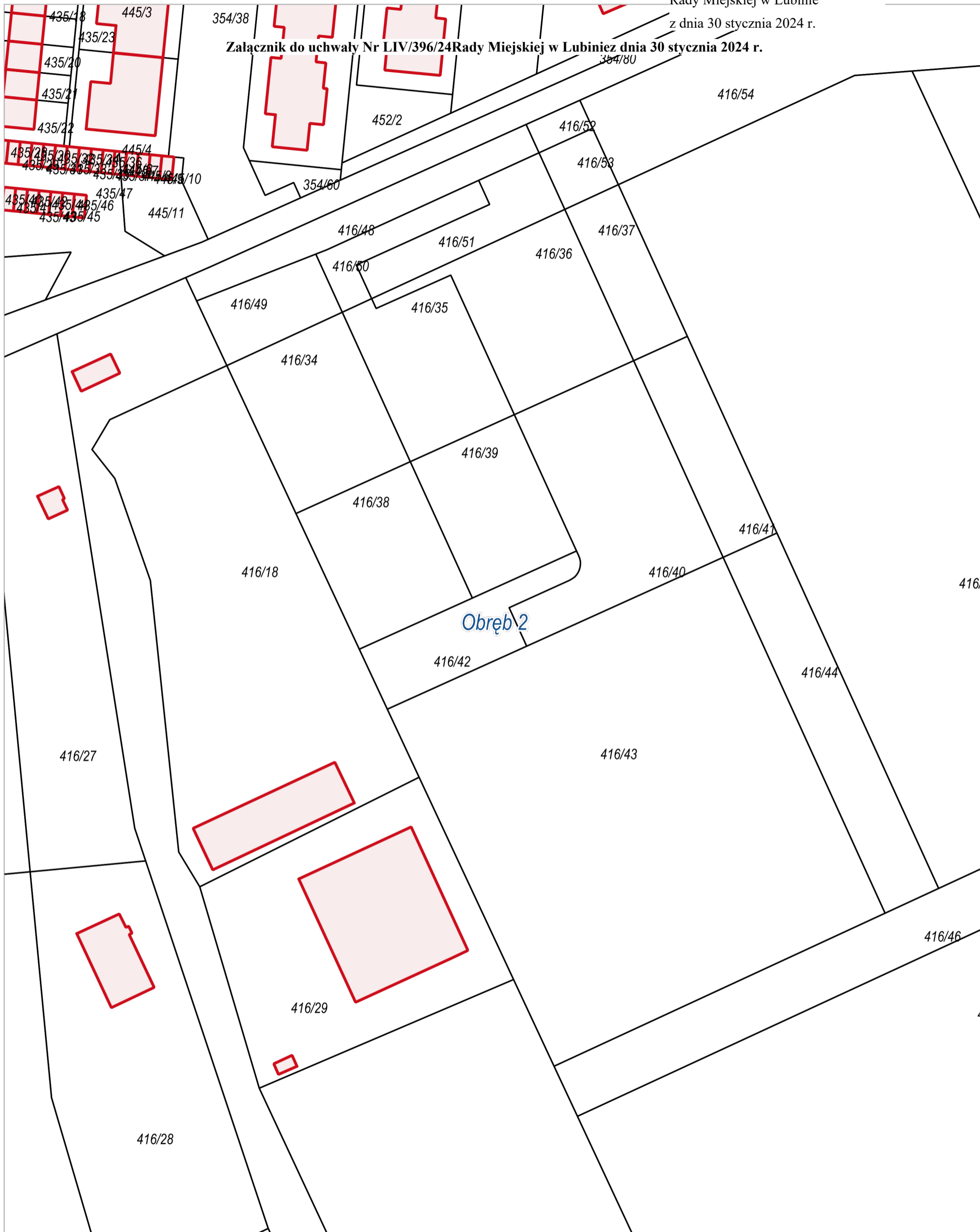
Obwód 2, Lubin (miasto)

Załącznik do uchwały Nr LIV/396/24 Rady Miejskiej w Lubinie z dnia 30 stycznia 2024 r.