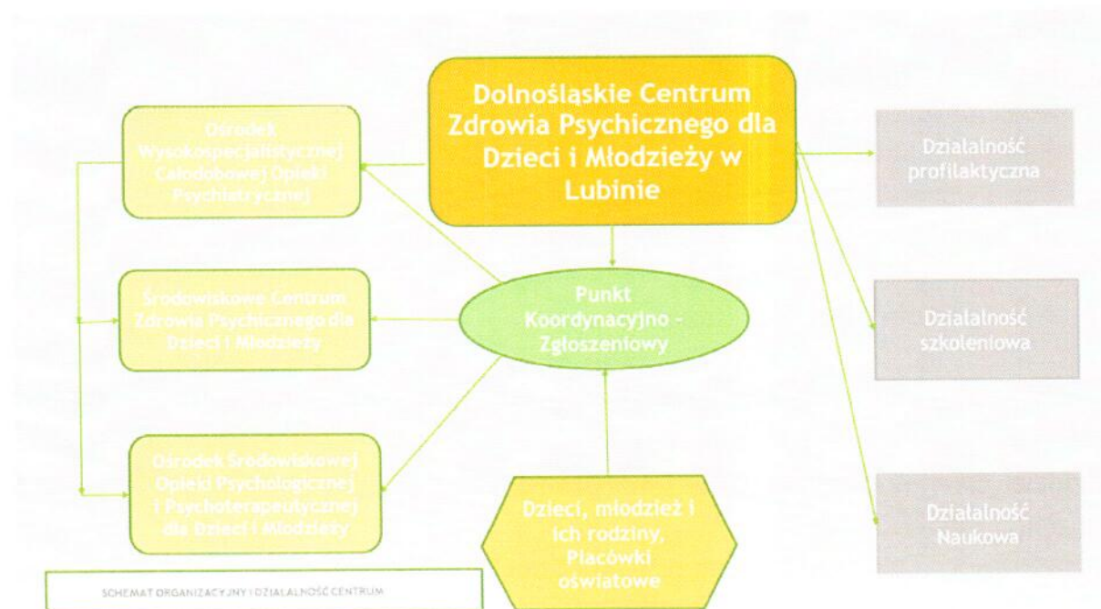
Tabela nr 2. Dolnośląskie Centrum Zdrowia Psychicznego dla Dzieci i Młodzieży w Lubinie.

Opracowanie własne: Schemat organizacyjny i za zadania Centrum